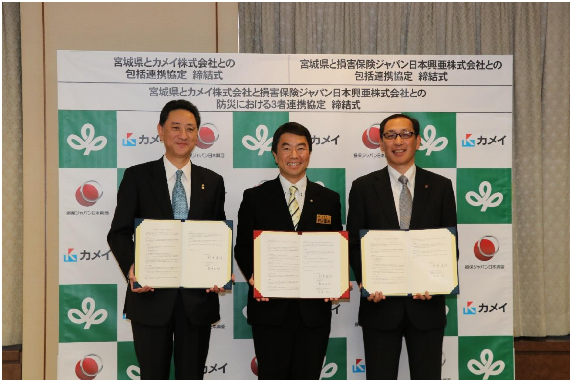
協定締結式の様子